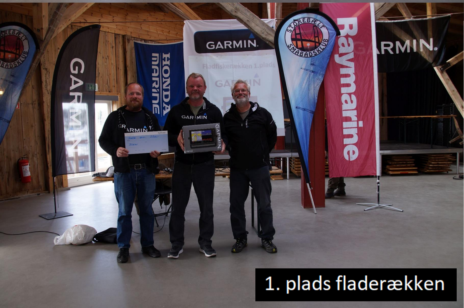
1. plads fladerækken