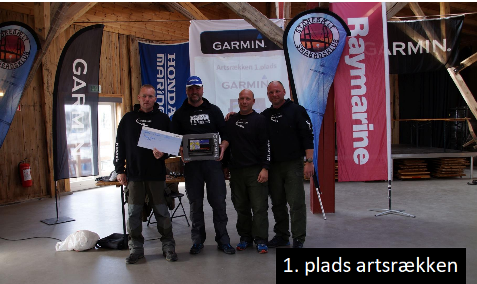
1. plads artsrækken